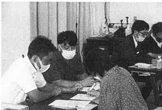
肥料高騰対策事務支援

担保に関する評価及び管理方針は、一定のルールのもと定期的に担保確認及び評価の見直しを行っています。なお、主要な担保の種類は自組合貯金です。