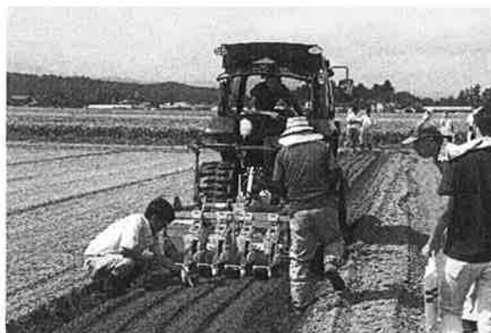
玉ねぎ直播実演会