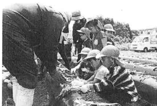
サツマイモ定植指導