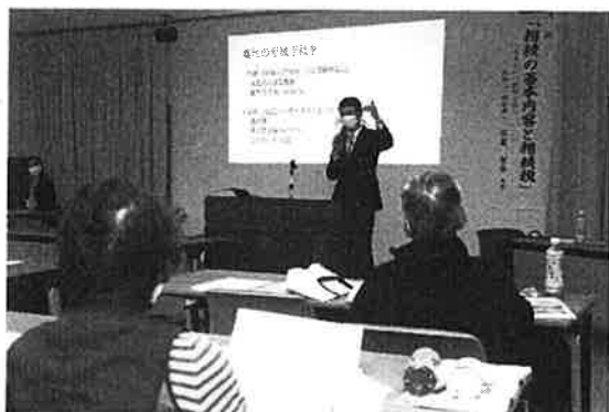
相続相談セミナー