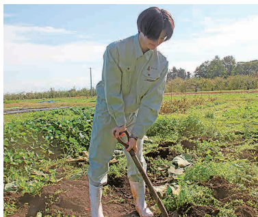
畑でサトイモ掘り