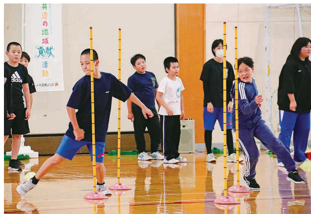
障害物を使用したトレーニングに励む児童

トレーニング後はJ Aから管内の新米を使ったおにぎり弁当等が手渡され、児童らは笑顔で受け取っていました。