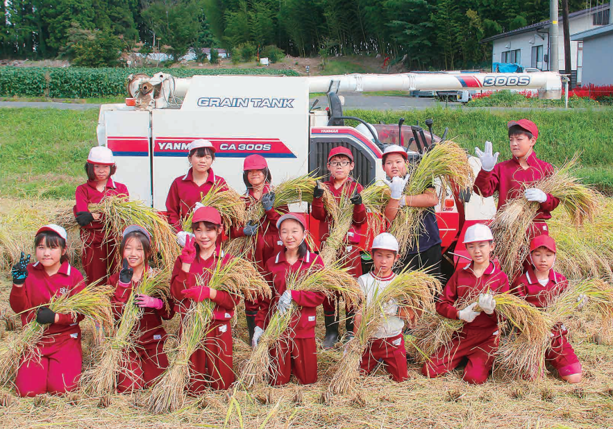
水田で稲刈りを行う児童